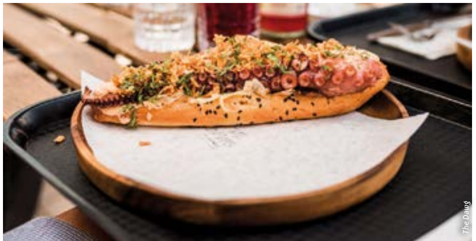
Hot Dog mit Tintenfisch und Sepiabrot: Das Berliner Lokal «The Dawg» setzt auf Gourmetvarianten des Fast-Food-Klassikers.

Burger, Kebab und Grillwürste sind teilweise aus der Fast-Food-Ecke getreten und im Gourmet-Himmel angekommen. Sie sind in sehr unterschiedlichen Qualitätsstufen erhältlich. Als Standard werden sich Gerichte wie Kebab mit Trüffel aber nur schon wegen der Preise kaum etablieren.