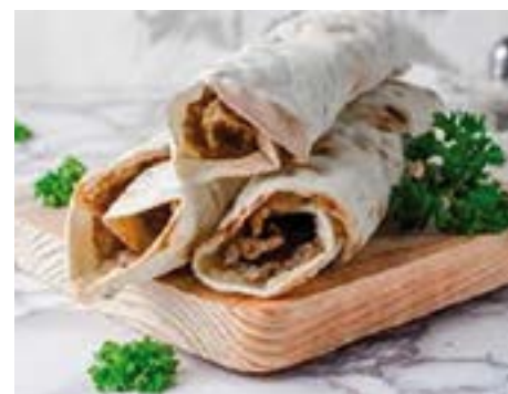
Ethnisch geprägte Snacks wie Kebab sind bei den Konsumenten sehr beliebt.

Nur wenige Verbraucher wählen das günstigste Angebot. Snack-Konsumenten sind bereit, mehr zu bezahlen, wenn es sich um ausgefallene Produkte mit regionalen Zutaten oder Bio-Label handelt.