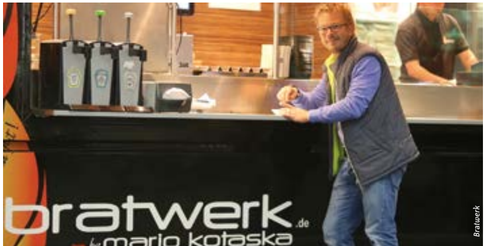
Der Fernsehkoch Mario Kotaska betreibt einen Imbisswagen und vermarktet Würste und Saucen in ganz Deutschland.