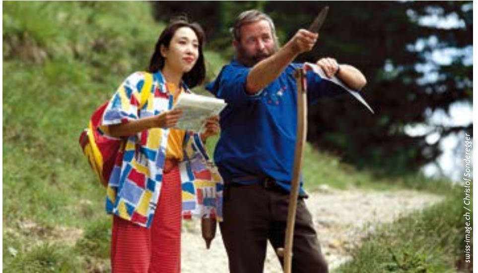
Ein Innerschweizer Bergbauer zeigt einer asiatischen Touristin den Weg. Die Zukunft gehört dennoch den digitalen Assistenten.

der Markt für smarte Assistenten nicht von wenigen grossen Playern unter sich aufgeteilt. Mit offenen, standardisierten Daten können sich auch Lösungen durchsetzen, welche die Privatsphäre der Nutzenden nicht unterwandern.