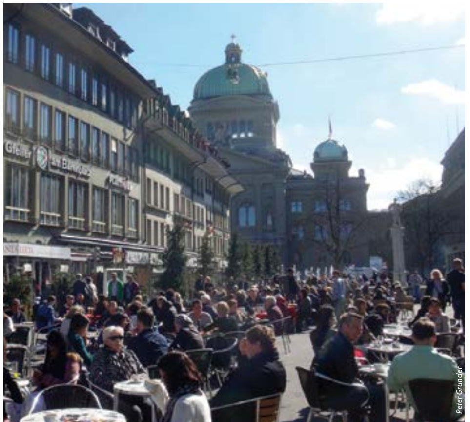
Das Gebot der Stunde: Praktiker statt Populisten ins Bundeshaus!